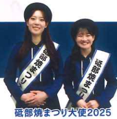
砥部焼まつり大使2025