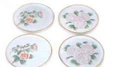
「砥部焼新作展2024」砥部焼まつり大賞